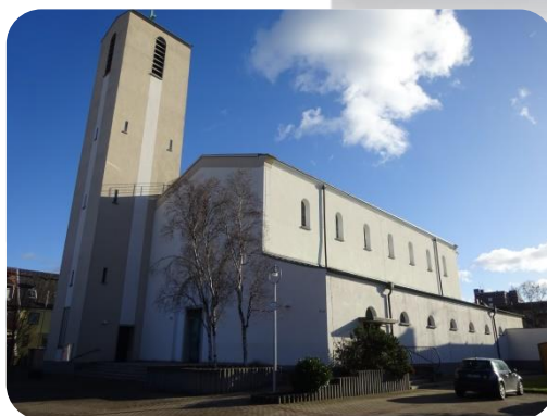
St. Hedwig, Gartenstadt