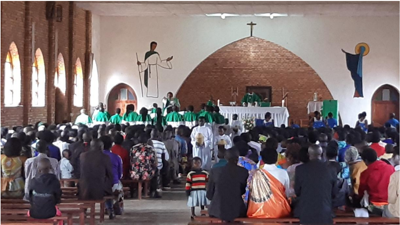
Frühmesse in der Pfarrkirche Rwankuba